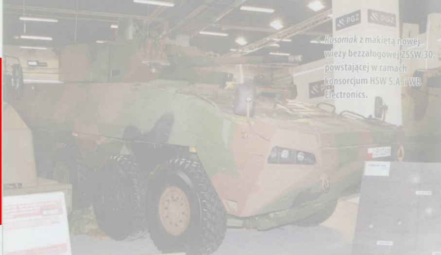
Rosomak z makieta nową wieży bezzałogowej ZSSW-30, powstającej w ramach konsorcjum HSW S.A. i WB Electronics.

Nagroda Lidera Polskiego Przemysłu Obronnego redakcji miesięcznika Nowa Technika Wojskowa: Wojskowy Instytut Techniczny Uzbrojenia z Zielonki.