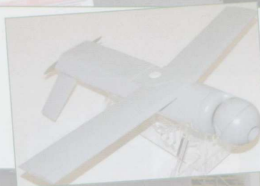
◀ Mikro-BSP Warmate w wersji rozpoznawczo-uderzeniowej z WB Electronics.